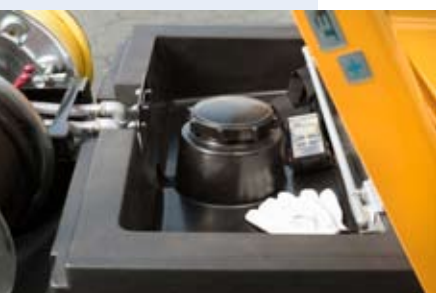
Prostorný box pro nářadí

Díky modernímu aerodynamickému designu a využití lehkých slitin, ze kterých je přívěs vyroben má flexjet+ nízký odpor vzduchu a hmotnost. Tyto vlastnosti nám dávají jedinečnou možnost přepravovat přívěs za jakýmkoliv autem, které může řídit řidič s běžným řídičským průkazem skupiny B.